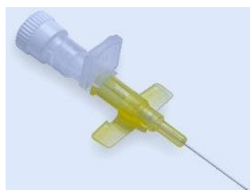
Cateter com asas pequenas e sem porta de entrada