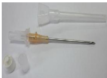
Cateter sem asas e sem porta de entrada

O Cateter Intravenoso SOLIDOR ® é utilizado para cateterização periférica para permitir a administração de drogas em infusões de fluidos e soluções e em pequenas transfusões. É dispositivo de contato com o paciente, que pode ser conectado a seringas, equipamentos. Não necessita de calibração ou manutenção, sendo dispositivo de uso único e esterilizado por exposição ao gás óxido de etileno.