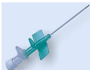
Cateter com asas de sem porta de entrada