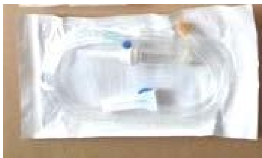
Fotografia 02 – Equipo de Infusão LAMEDID® em sua embalagem unitária.

Informações gráficas, para visualização do produto: