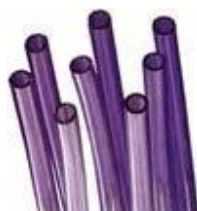
Tubos de PVC