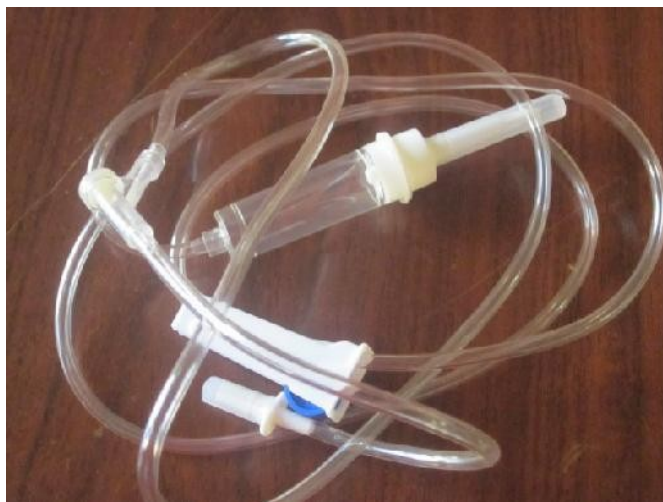
Fotografia 01 – Equipo de Infusão LAMEDID®